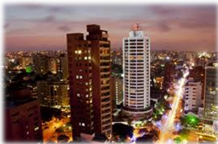
Ciudad de Barranquilla