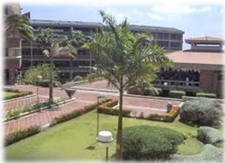
Universidad del Atlántico

La UNIVERSIDAD DEL ATLÁNTICO, lugar sede del EIMAT 2014, es una institución pública de educación superior con gran reconocimiento, considerada como la universidad con más estudiantes de la región Caribe colombiana, 20.000 actualmente, entre pregrado y posgrado. La universidad está ubicada en el Km 7, antigua vía a Puerto Colombia, Barranquilla - Atlántico - Colombia.