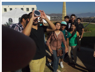
Aprovechando para ver el eclipse parcial de Sol