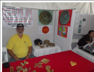
Un aspecto de nuestro estante

Universidad Autónoma de Baja California Facultad de Ingeniería, Arquitectura y Diseño