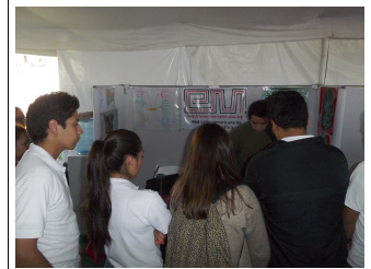
Otro aspecto del público