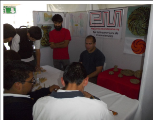
Alumnos y Becarios de la FIAD exponiendo sobre Etnomatemáticas