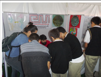
Con algunos de los visitantes