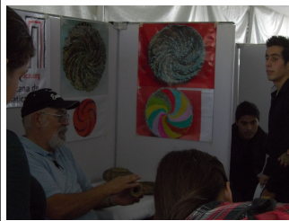
En una explicación del uso de artesanía como parte de un Proyecto de Aula