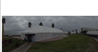
Vista panorámica de la carpa de la exposición