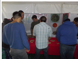
Cuatro días de exposición