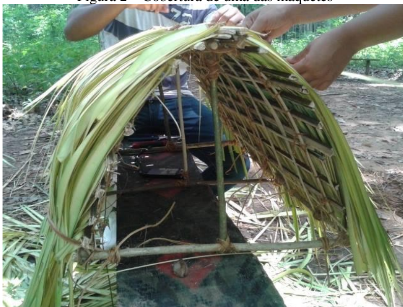
Figura 2 – Cobertura de uma das maquetes