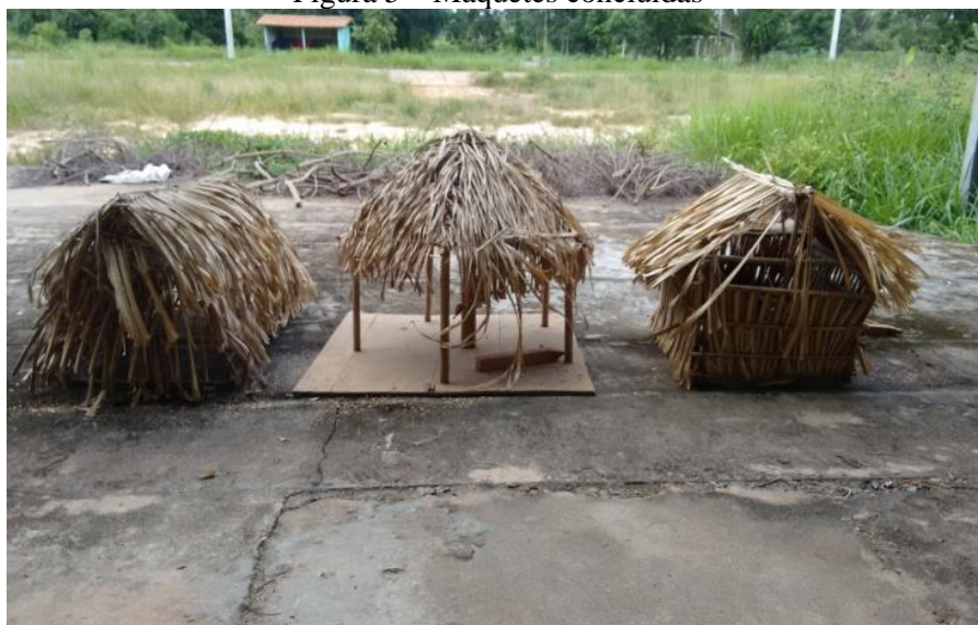
Figura 5 – Maquetes concluídas

Na figura 5 temos as maquetes já prontas ao término das atividades propostas. O tapirí encontra-se ao centro. Note que os educandos colocaram, por sugestão dos professores que acompanharam o processo, uma placa de compensado na base, fixando as colunas do tapirí, para que a maquete pudesse ser movimentada de um lado para outro.