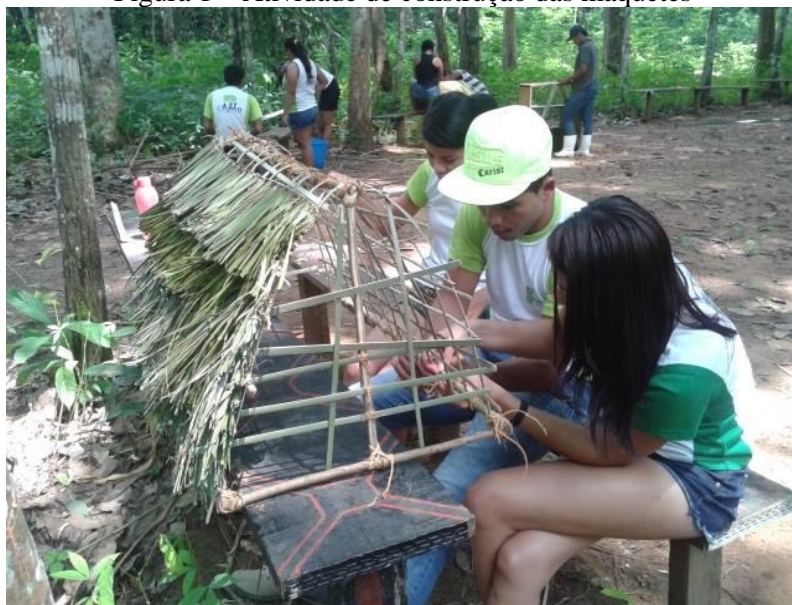
Figura 1 – Atividade de construção das maquetes