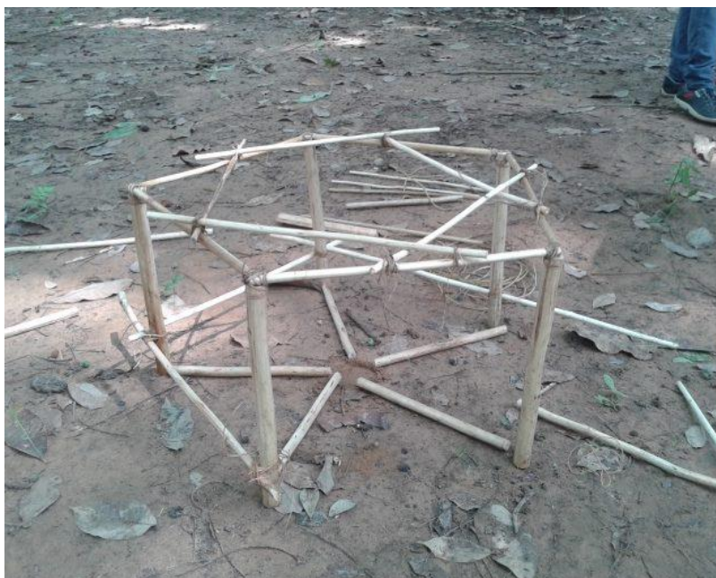
Figura 4 – Formas matemáticas na construção do tapirí

O professor de matemática destes indígenas informou que o conhecimento dos mesmos, sobre o conteúdo de geometria plana, em especial referente a polígonos regulares, era limitado. Segundo os próprios indígenas, eles usam estimativas na maioria dos casos práticos. Por exemplo: o dimensionamento da roça é realizado de forma empírica, considerando uma área que supostamente seria suficiente para a produção necessária a suprir as necessidades alimentares da aldeia, na entressafra. De modo análogo, eles não utilizaram conhecimentos escolarizados na construção da base do tapirí.